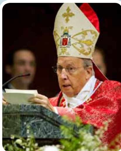
Lettera di Mons. Javier Echevarría (febbraio 2012)

Preghiamo per tutti i Pastori della Chiesa, perché tutti, con Pietro, Capo visibile del Corpo mistico, andiamo a Gesù per mezzo di Maria.