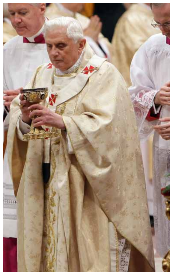
Sua Santità Benedetto XVI